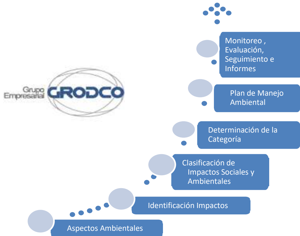
Figura 3: Evaluación Socio – Ambiental de proyectos del Grupo Empresarial Grodco.

En la figura 3, se presenta el procedimiento de cómo se evalúa los componentes sociales, ambientales y culturales de los proyectos.