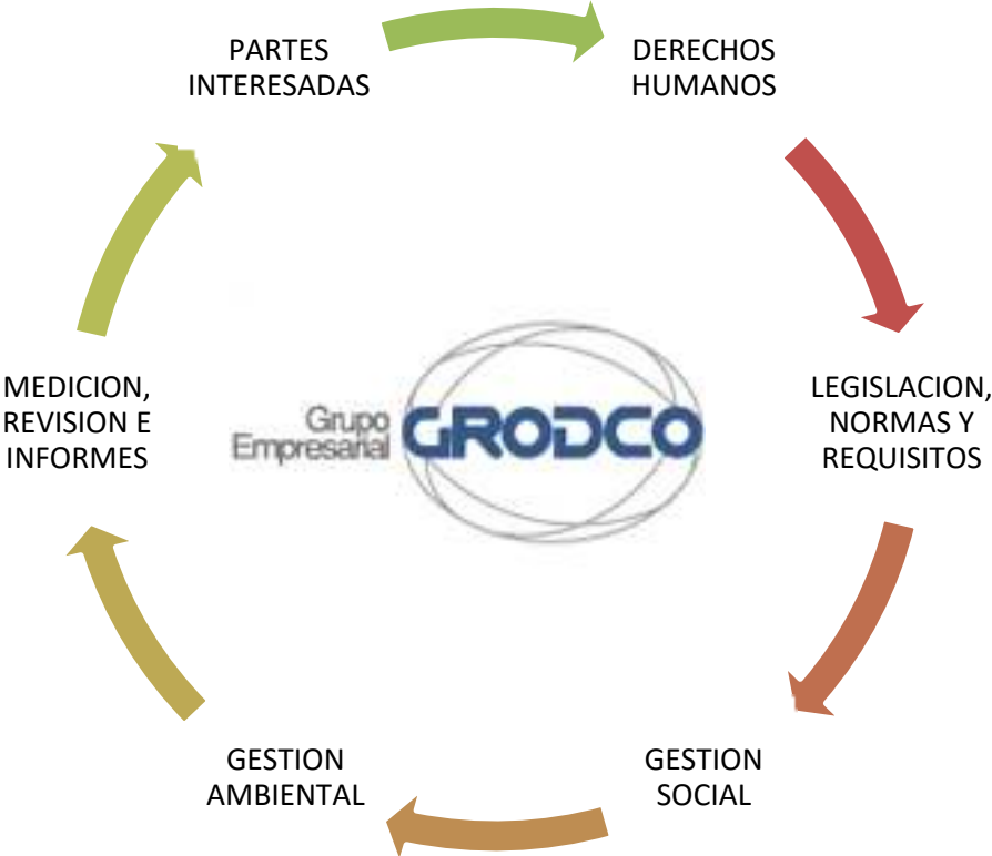
Figura 1: Planeación y Adopción de los Principios de Ecuador en el Grupo Empresarial Grodco

En la Figura 1, se presenta la forma como el GRUPO EMPRESARIAL GRODCO, adopta de manera general los Principios de Ecuador.