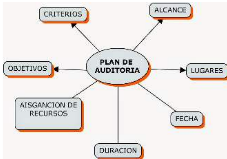
Figura 4: Esquema general de la realización de auditorías.

Adicionalmente, los proyectos que realizan las empresas del Grupo Empresarial, están sujetas a auditorías por parte de Interventores, quienes de manera independiente auditan el cumplimiento de los requisitos legales, normas y otros. En la figura 4, se presenta el esquema generalizado para el desarrollo de las auditorías al Sistema de Gestión Integrado, SGI.